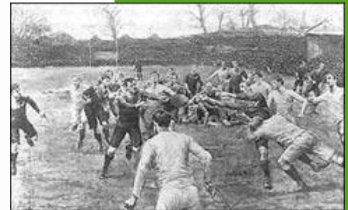
Les premiers matches de Rugby

C'est ainsi que tous ces jeux évoluèrent en Angleterre jusqu'à la fin du XIX e siècle, période à laquelle prit naissance le jeu nommé "RUGBY" !