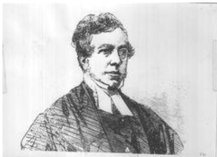
William Webb Ellis

La légende veut que le Rugby ait pris naissance au Collège de Rugby (Angleterre), ce jour de novembre 1823 où un élève du nom de William Webb Ellis se mit à courir avec le ballon dans ses bras, au cours d'une partie de Football.