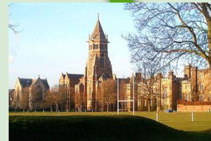
Collège de Rugby

La légende veut que le Rugby ait pris naissance au Collège de Rugby (Angleterre), ce jour de novembre 1823 où un élève du nom de William Webb Ellis se mit à courir avec le ballon dans ses bras, au cours d'une partie de Football.